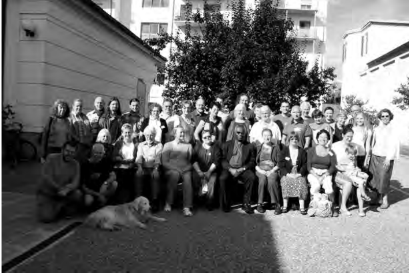
Groepsfoto van de deelnemers van het Lekenforum 2011

Tot slot roep ik mijn medeparochianen en medeleken op om volgend jaar naar het Lekenforum te gaan. Nederland organiseert in 2012 het forum. Het al dan ook in Nederland plaatsvinden, om precies te zijn in het Arnold Janssen klooster te Wahlwiller, in de buurt van Maastricht: http://www.arnoldjanssenklooster.nl/ van 15 tot en met 19 augustus.