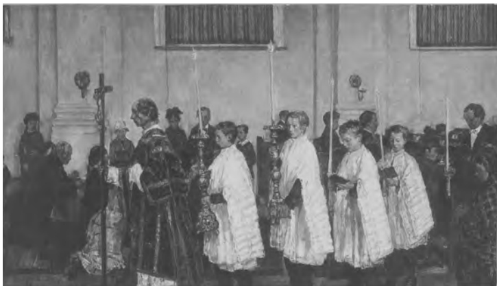
Processie in de Oud-Katholieke Kerk van Den Haag bij Maria Lichtmis, Isaac Israëls 1881

helemaal duidelijk, maar er zijn aanwijzingen van een waar acolitaat in Rome. Rome was in wijken ingedeeld, zodat de diakens hun werk goed georganiseerd konden verrichten. Hierbij werden ze geassisteerd door acolieten. Vandaar hun naam ἀκολουτος , dat volgeling betekent. Van hun liturgische betekenis in die eerste eeuwen weten we eigenlijk niets, wel dat ze ook als overbrengers van brieven werden ingezet en de gevangenen ondersteunden. Met deze gegevens in gedachten, kunnen we hun rol in de liturgie ook beter begrijpen, ook daarin werkt de acoliet ondersteunend.