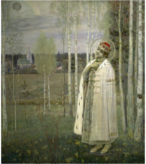
Mikhail Nesterov (1862-1942), De vermoorde tsarevich Dmitry

Het schilderij doet denken aan Noli me tangere, van Fra Angelico, waarop de verschijning van Jezus aan Maria Magdalena op de paasmorgen is afgebeeld. "Noli me tangere, raak mij niet aan, want ik ben nog niet opgevaren naar de Vader," zegt Jezus tegen Maria Magdalena. Ook de tsarevitch is onaanraakbaar, nog niet