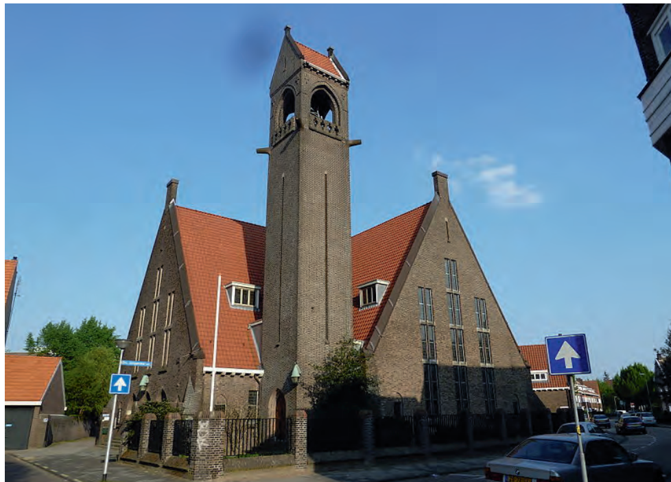
De kerk aan het Templesplein

In mijn familie bestond een traditie van gemengde huwelijken. Dat begon bij mijn grootouders van vaderskant. Mijn grootmoeder was protestant, mijn grootvader katholiek. Ze trouwden in de hervormde kerk; de kinderen werden hervormd gedoopt. Toen mijn grootvader op zijn sterfbed lag, werden hem de laatste sacramenten geweigerd, omdat hij in zonde leefde. Een verlichte kapelaan wist te voorkomen dat hij alsnog met mijn grootmoeder moest trouwen en zo kon hij toch in vrede sterven. Een broer van mijn vader trouwde met een